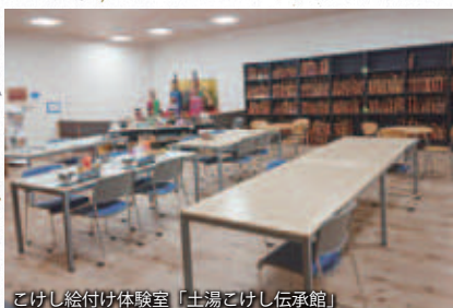
こけし絵付け体験室「土湯こけし伝承館」