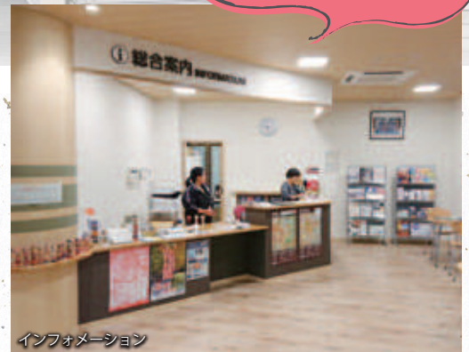
インフォメーション

〒960-2157 福島市土湯温泉町字坂ノ上27-3 ☎024-572-5503 FAX 024-572-5503 ✉yumebutai@bz04.plala.or.jp ※まちWi-Fi有り(フリー)