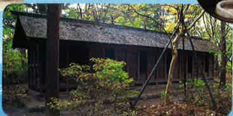
旧佐久間家板倉 (市指定有形民俗文化財)