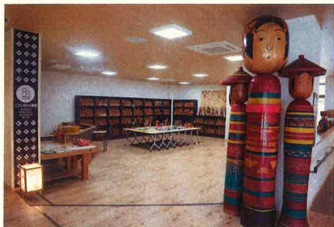
▲館内に入ると目の前に「巨大こけし」がお出迎え。身長は約3メートル、体重は約300kgと迫力満点！