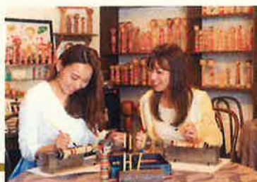
▲絵付け体験（イメージ）