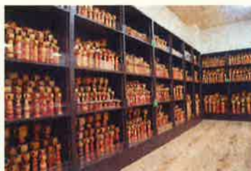
▲約3,200体の多種多様なこけしが並ぶ。