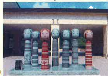
▲モニュメント「こけしのほほえみ」で記念撮影が可。

「土湯こけし」を初めとする東北各地のこけしが部屋一面に約三、二〇〇体展示。こけしの絵付け体験ができるほか、定期的に各種ワークショップ等も開催いたします。